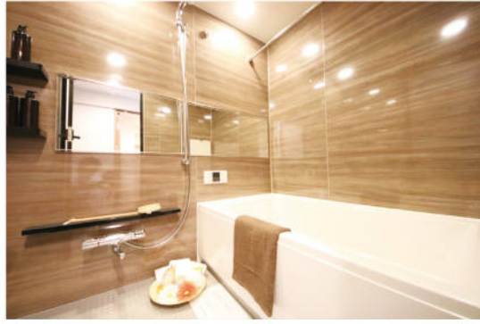
▲施工例 ユニットバス