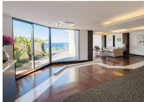
▲ エントランスホール