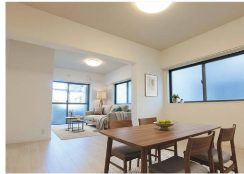
▲リビング※室内家具等は合成になります