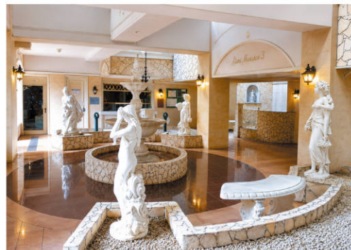
▲エントランスホール